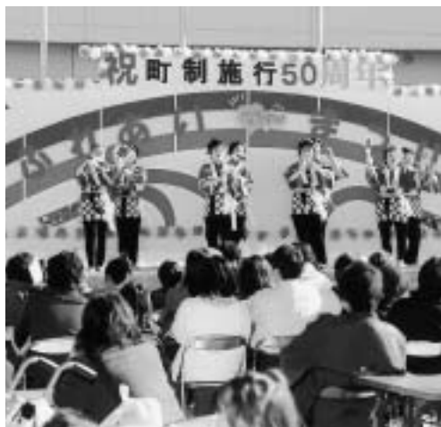
◀ 第三小学校校区 ▶

校区のみんながひとつになって 町制施行50周年記念校区コミュニティ祭り開催 須恵町には、3つの小学校があり、その小学校校区を単位とした「校区コミュニティ祭り」が、11月23日(日)に、各小学校で開催されました。 各校区とも、子どもから大人までみんながこの祭りに参加してひとつになり、地域づくり、まちづくりが繰り広げられていました。 当日は、透きとおった晴天に恵まれ、第一小学校は「すこやか秋まつり」、第二小学校は「べつたんフェア」、第三小学校は「ふれあいまつり」と題して開催されました。どこも、各種団体からいろいろな出し物や出店、福引き大会やもち投げなどが行われ、たくさんの人出でにぎわっていました。