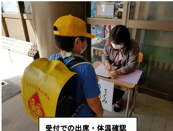
受付での出席・体温確認

臨時休校期間、2日間の分散登校を経て、今日からいよいよ令和2年度前期が始まりました。保護者の皆様におかれましては、課題配布に際してのご来校、ご家庭でのお子さんの学習指導、体調管理など様々な面でご協力いただきありがとうございます。さて、先日の分散登校では、いつもと違った形での登校、学校生活でしたが、どの学年でも子ども達の元気な姿が見られ、学校が活気づきました。子どもが登校し、学校生活を送るという当たり前の日常が、大変かけがえのない事であることを全職員実感しました。今後も新型コロナウイルス感染予防に努めながら、本年度の教育活動を進めて参ります。本年度も本校教育活動へのご理解、ご協力どうぞよろしくお願いいたします。