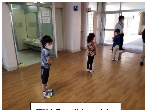
距離を保って並んでいます。