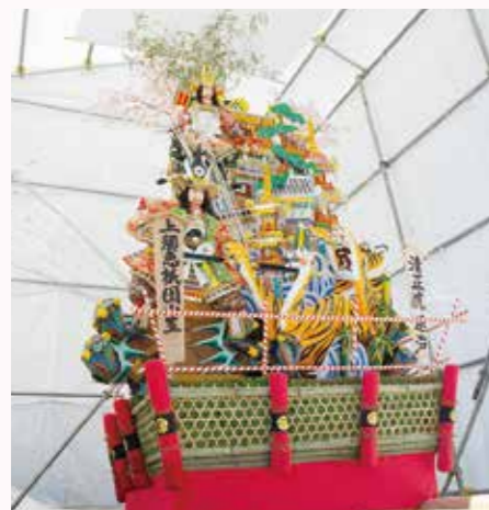
※写真は昨年のものです。