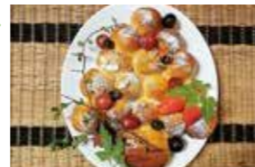
12月教室 ツリーパン