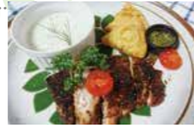
開講式 メディカルハーブ料理

☎ 健康増進課 健康対策係 ☎ 687-1530(ダイヤルイン) ☎ 932-1151(内線167)