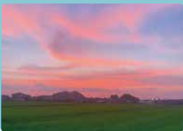
yumint0212 さん (撮影場所：旅石)