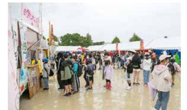
露店が立ち並びグラウンドの様子