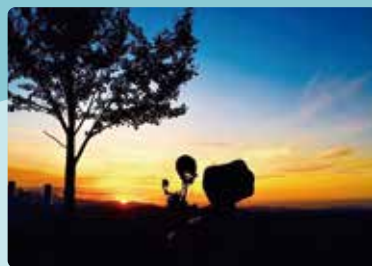
yowamusi_88 さん (撮影場所：皿山公園)