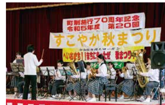
須恵中学校吹奏楽部による演奏

第20回すこやか秋まつり(すこやかコミュニティ主催)が須恵第一小学校で4年ぶりに行われました。雨天の中での開催となりましたが、多くの来場者が訪れていました。ステージでは幼稚園児から高校生までの子どもたちによる発表や抽選会が行われ、会場は大盛況となりました。また、グラウンドにはたくさんの露店が立ち並び、来場者は飲食やゲームなどを楽しみました。