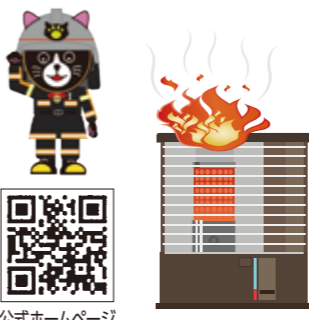
公式ホームページ

※火災を早期に見察するために住宅用火災警報器を設置しましょう。 ※住宅用火災警報器は定期的な作動確認を行い、設置後10年を目安に交換しましょう。