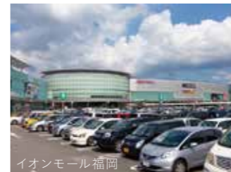
イオンモール福岡

町内には、スーパーやホームセンター、ドラッグストアやコンビニエンスストアなどの商業施設があり、さらに、車で約10分走れば、九州最大級のショッピングモールにも行け、映画も楽しめます。