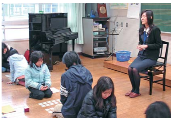
ボランティア派遣事業（百人一首）