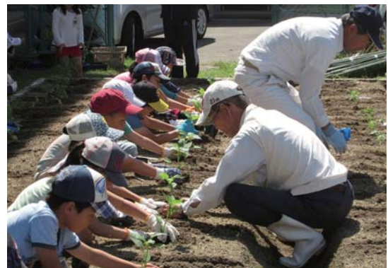
ボランティアによる野菜作り教室