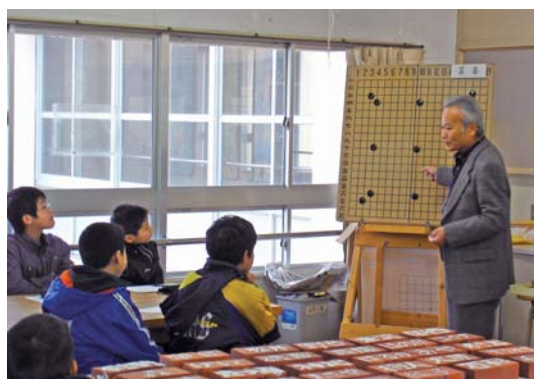
ボランティア派遣事業（囲碁クラブ）