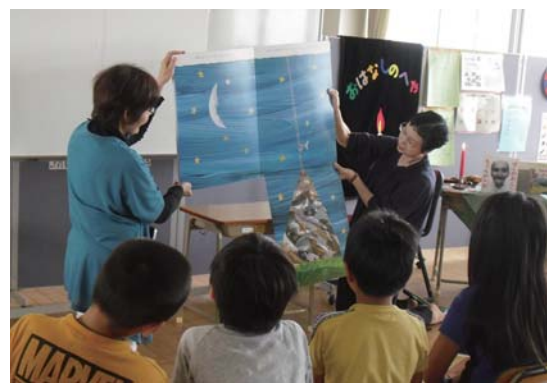
ボランティアによる読書教室