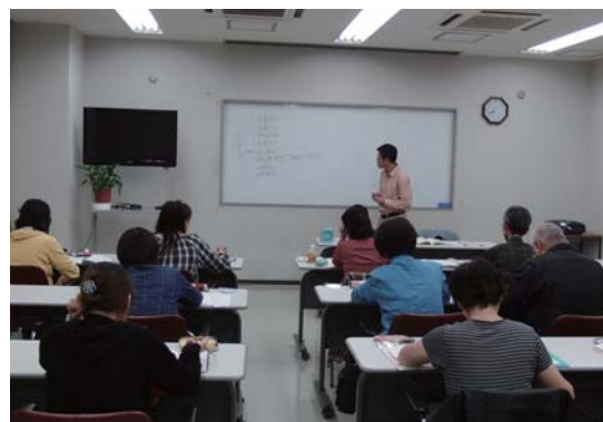
生涯学習講座まなビック