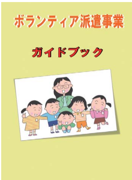
ボランティア派遣事業ガイドブック