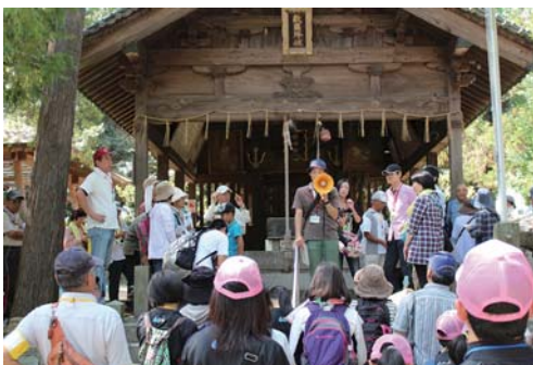
いきいき歴史探訪ウォークラリー