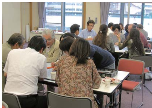
ワークショップ形式による研修会開催風景