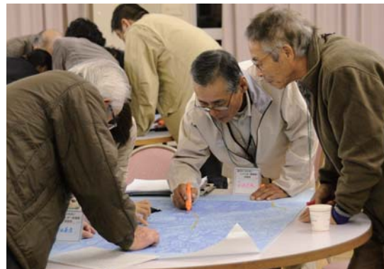
校区コミュニティ主催 まちづくり懇談会