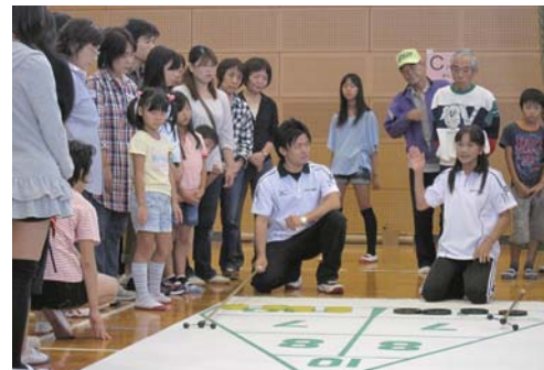
ふれあい軽スポーツ大会