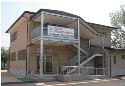
すこやかコミュニティセンター