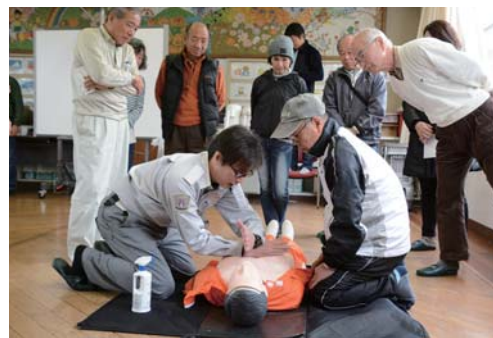
すこやか防災訓練