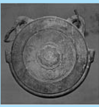
▲町指定文化財 建正寺仏教大師堂鯛口

考古学において取り扱う資料は、古いものでは何千、何万年も前のものがあります。このような資料は1点ではいつのものか分かりません。そのために相対年代を積み重ねてひ