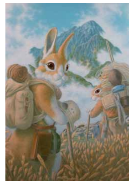
映画「剣岳・記」より事前調査の午後