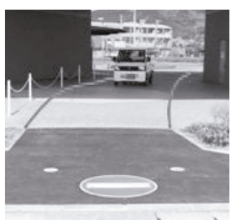
第3駐車場側からは通行禁止 ピロティ内は駐車禁止