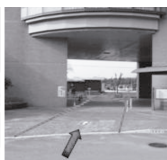
ロータリー側から一方通行走行中は徐行運転を