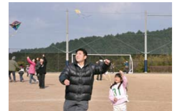
どこまでも高く揚げられ

独創的な参加者のたこは、時には糸が絡み合いながらも、糸が足りないほど空高く揚がっていました。大会結果は次のとおりです。(敬称略)