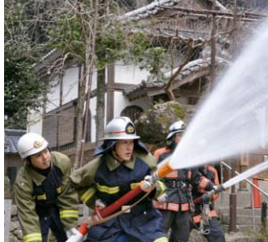
見事な連携で放水

サイレンが吹鳴すると、堂守が敏速に初期消火の最中に、粕屋南部消防署員や町消防団員が到着し、防火水槽とタンク車からホースを張って放水を行いました。