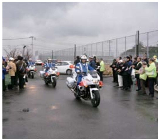
多くの人たちに見送られながら出発

参加者たちは、「飲酒運転の撲滅」「青少年の非行抑制」「暴力団排除」「性犯罪の抑制」を目標に、地域と一体となって活動していくことを誓われていました。