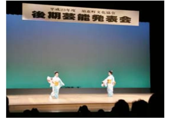
息もぴったり合った演技にうっとり

この発表会では、邦楽、和舞踊、歌謡、華道などのさまざまなサークルが出演。各出演者の見事な発表に、客席からは大きな声援や拍手が贈られていました。