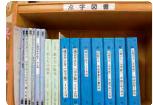
点字図書コーナー

図書館では、広報すえの点字版を置いています。その他多くの点字図書があり、貸出も行なっています。ぜひご利用ください。