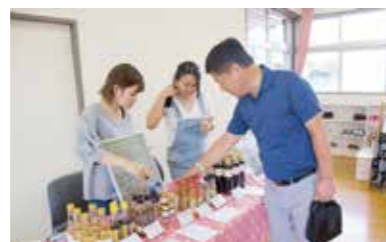
小物販売を見て楽しむ