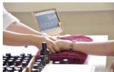
ハンドマッサージ