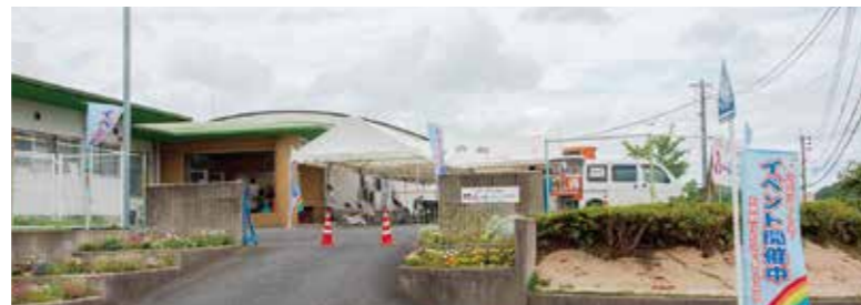
ふれあいレインボー事務局