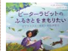
リンダ・エロピッツ・マーシャル / 文 イラリア・アービナティ / 絵 おびか ゆうこ / 訳 廣済堂あかつき / 発行

2022年春に120周年をむかえる「ピーターラビットのおはなし」誕生秘話を絵本にしています。イギリスの当時の社会情勢などを取り入れながら、作者の苦勞とやさしい想いが描かれています。 その「想い」が込められたイギリス湖水地方の風景の中で、作者に見守られながら、ピーターラビットが今も跳ねているように思えます。