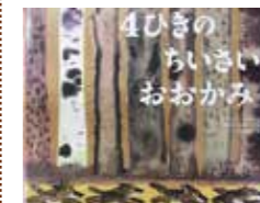
スベンヤ・ヘルマン / 文 ヨゼフ・ヴィルコン / 絵 石川 素子 / 訳 徳間書店 / 発行

夜中、目を覚ますとおかあさんがいません。いつもなら、おかあさんが帰ってくるまで「巢」の中にいる子どもたち。 今日は、なんだかようすが違います。4ひきだけで外に出てみました。はじめて自分たちだけで歩く森の中で、いろんなことが待っています。 無事に、おかあさんおおかみに会えるのでしょうか。