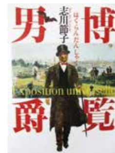
志川 節子 / 著 祥伝社 / 出版

本書は、文明国を目指した一人の男の物語です。 黒船来航から、「大政奉還・王政復古へ」と大きく舵をきった日本。「犬は、夜を守り…人学はずんば、物に如かず。」 主人公は、「三字経」に代表される中国の学習書などを学び、「巴里万国博覧会」などを通して、富国強兵だけではなく、「日本の文化」を振興・発展させて欧米列強と並ぶ「真の文明国 日本」を目指した人です。