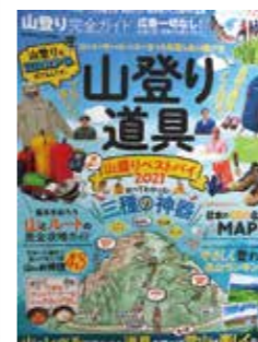
武田 義尊 / 編集 晋遊舎 / 発行

「人の数だけ山の楽しみ方があります。」 トレッキング・山歩き・ハイキング・トレイルランなどを楽しみたい人向けのガイドブックです。 「山登り道具選び」と「山登りの基本」を、レベル別に「初級・中級・上級」と分けてあるので選びやすくなっています。 人混みを避けて、自然の中で過ごしてみませんか。