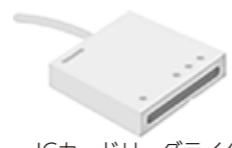
ICカードリーダライタ