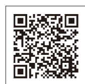
マイナンバーカード 読取対応端末の一覧

メリット：添付書類の省略が可能！還付金が早く受け取れる！24時間いつでも申告可能！