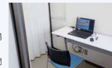
確定申告自己作成コーナー

※操作方法の質問などはお答えしますが、申告内容の相談・質問にはお答えできませんのでご注意ください。