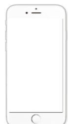
スマートフォン (マイナンバーカード に対応した)