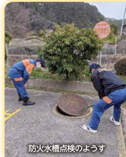
防火水槽点検のようす

こんにちは。須恵町消防団佐谷分団です。佐谷分団では、いつ火災などの災害が起きても活動できるように、毎月佐谷区内の防火水槽の点検や機械器具の点検を行なっています。また、佐谷区の行事である建正寺の御開帳や佐谷区夏祭りでの警備、コミュニティの秋祭りへの参加など、さまざまな地域行事へも参加しています。消防団と言えば、酒飲みや厳格なイメージがあるかもしれませんが、今はそんな事は無く、みんな楽しく活動しています。