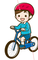
あごひもがあること