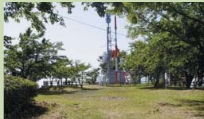
高鳥居城の曲輪(岳城山の展望台・テレビ塔のある平地)

今回は中世山城の話でした。今回からはいよいよ高鳥居城に設けられた様々な防御施設を紹介します。