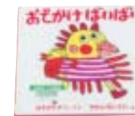
「おでかけばいばい」 はせがわ せつこ 作 やぎゆう けんいちろう 絵 福音館書店