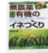
「あなたにもできる 無農薬・有機のイネづくり」 稲葉 光國 著 農山漁村文化協会

アジアモンスーンの風土の中で成り立つ有機稲作の技術であって、多様に富んだ水田生物を再生し、その生態を稲作に活用する手法を紹介。無農薬・有機栽培を失敗しないためのポイントも具体的に解説する。