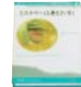
「ミステリーセレクション」 全10巻 赤木 かん子 編 ポプラ社