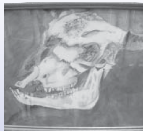
大塚 誠太郎「牛骨」 (須恵東中2年)