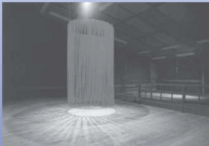
「a hidden my room」

目に見えないものに意識を向けています。それは、内面(心)であったり、記憶であったり、ふくらむ想像であったりします。自身の内面に向かいながら(小さな問題であったり、個人的な悩みであったり)その中に潜むひとつひとつを整理するように作品を制作しています。作品は空間を用いたインスタレーションが主であり、制作過程を含み、その展示空間に自身が組み込まれることで、見えないものを整理できるのかもしれませんが。それは私だけに限らず、観る方それぞれの内面の整理にも通じるのではないかと考え、制作しています。