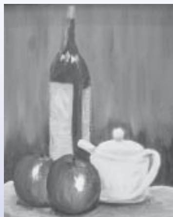
赤司 真里菜「りんご」 (須恵東中2年)