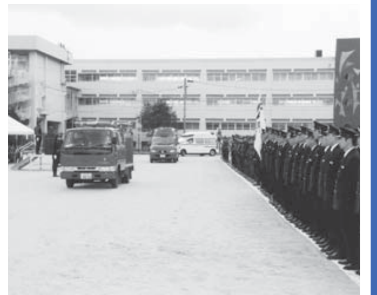
消防車両の入場行進