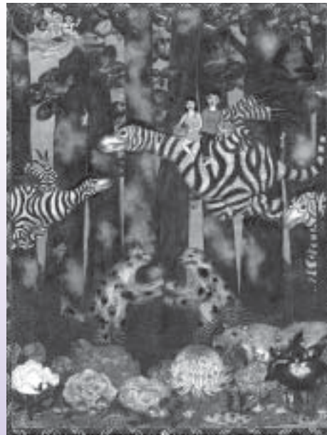
ひかり射す森 今村 史織