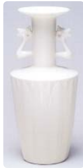
牙白瓷鳳凰耳付花入

吉村達治展 「見捨てられたモノたち」 7月17日(土)～8月1日(日) ※20日(火)・26日(月) 休館