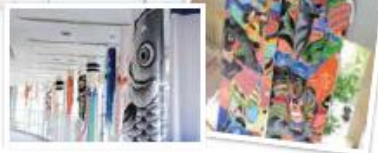
写真はすべて昨年の様子

端午の節句に、子どもたちの健やかな成長を願い、青空を泳ぐこいのぼり。須恵町では、町内の有志の人たちから寄贈いただいたこいのぼりを、今年も掲揚しています。大切に保管され、たくさんの想いが詰まったこいのぼりが、初夏の風を受けて元気よく泳ぐ姿を、ぜひご覧ください。