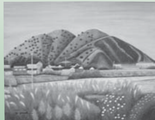
山岡 幸雄「秋の硬山」油彩 1997年