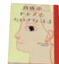
「真珠のドレスとちいさなココ」 ドルフ・フェルルーン著 主婦の友社

マリアは12歳になった。12歳といえばもう大人。華やかなパーティが開かれた。豪華で素敵な贈り物をたくさんもらった。その中にちいさな奴隷のココがいた。実際にあった出来事をもとに、忘れてはならない歴史を教えてください。1冊。