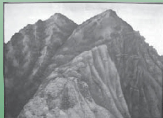
近藤 奈穂美「ぼた山」日本画 2002年