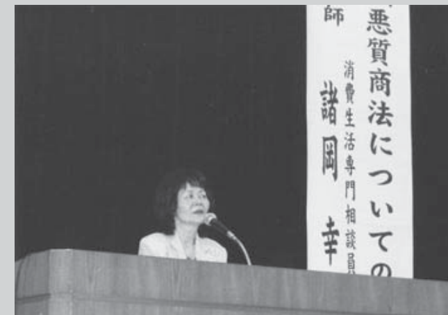
65歳以上の人が参加して行われる「高齢者学級」

また、同連合会は、今月から同連合会会員の加入促進運動を展開しています。連合会では、「満65歳以上で、まだ老人クラブに加入していない方は、この機会にぜひ加入してください。一緒に「若々しい」活動をしましょう。連絡は各区の老人クラブまで。」と話しています。