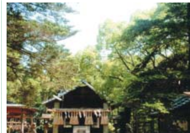
秋の紅葉も見事な須賀神社

かやの保育所 ☎932-4836 東幼稚園 ☎932-6313 南幼稚園 ☎933-2400