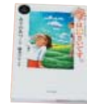
「舞は10さいです。」 あさの あつこ 作 新日本出版社

舞は4年生。ある日おねしょをしてしまった。そのことを同じクラスで同じマンションに住むなおみちゃんに知られ舞は悩む。「だれにもいわないで」と話しかける勇気がでない…。