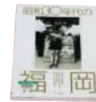
「昭和30年代の福岡」 アーカイブス出版編集部 編 アーカイブス出版

昭和30年代の福岡の風景が、生活に根ざした角度で撮影されている。隣町の志免町についても、炭鉱炭住街に住む人々の日々の暮らしがフィルターを通して写し出されている。