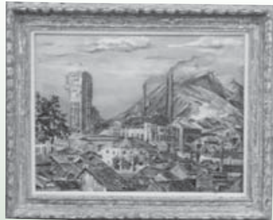
江頭 春行「光ヶ丘より」油彩 1949年