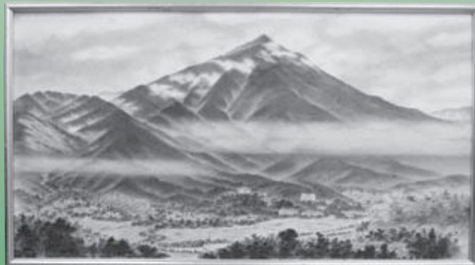
栗原 大芳「若杉山」墨 制作年不詳