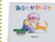
「あなたがだいすき」 鈴木 まもる 作 ポプラ社

「わたしはあなたがだいすきです」「あなたがいるだけでわたしはしあわせ」大切なあなたへ心から伝えたい「だいすき」な気持ち。絵本を通して「だいすき」を伝えてみませんか。