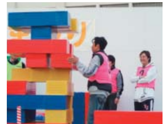
すこやか秋まつり