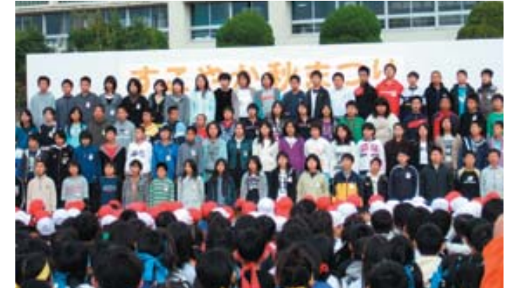
すこやか秋まつり

■ 糟屋6町合併研究会事務局 〒811-2301 糟屋郡粕屋町大字上大隈55番1 糟屋郡自治会館内3階 ■ 電話 939-9966 FAX 939-9967 E-mail info@kasuya6gappei.jp