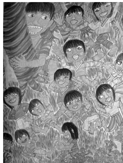
須恵第三小学校6年生児童による作品