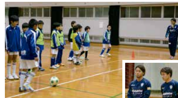
プロサッカー選手からの指導を熱心に受ける子どもたち