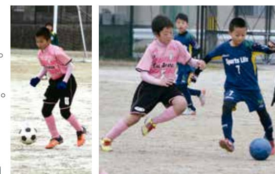
台湾チームとアザレアF C試合風景

試合後の交流会では、両国の子ども同士すぐに打ち解け、会場内には子どもたちの笑い声が響き渡っていました。