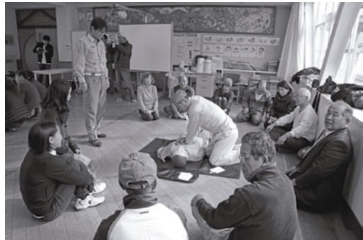
心肺蘇生法を体験しました

平成27年12月6日（日）、すこやか防犯週間普通救命講習（すこやかコミュニケーション主催）が須恵第一小学校で開催され、54人が参加しました。