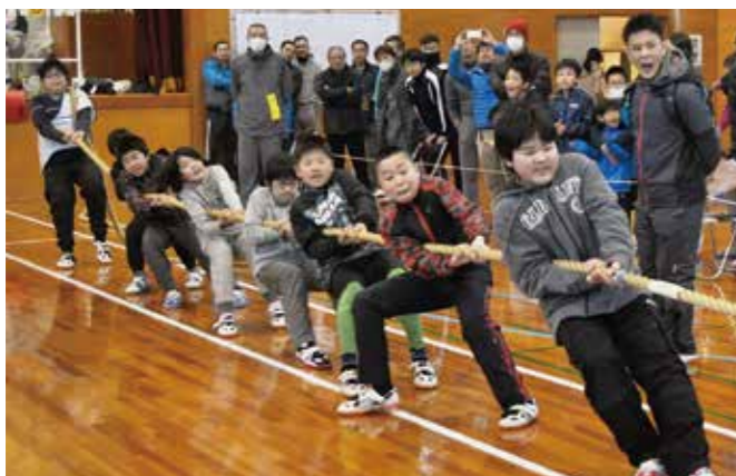
力いっぱい綱をひく子どもたち

第32回綱引き大会(須恵町体育協会主催)が須恵中学校体育館で行われ、行政区や各種団体から26チーム(274人)が出場しました。