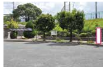
②正信会 水戸病院前 (旅石～山の神線 両方面回り)

☎ まちづくり課 ☎ 932-1153(ダイヤルイン) ☎ 932-1151(内線342)