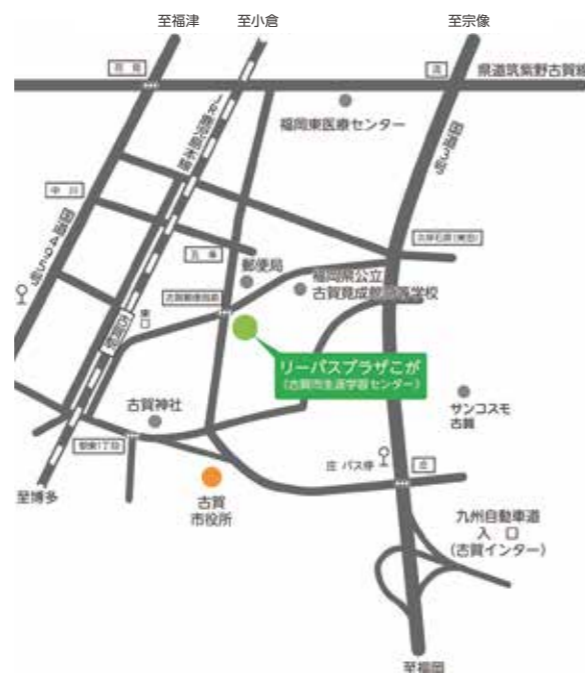
リーパスプラザかが位置図

☎ 福岡県東福岡県税事務所 地方税収対策本部 福岡地区特別対策班 ☎ 641-0170 古賀市役所 市民部収納管理課 ☎ 942-1124 当日連絡先 ☎ 090-2508-3554