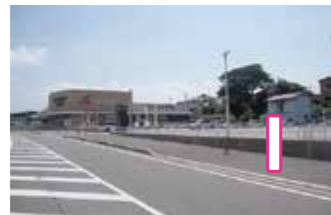
①Aコープ須恵店前 (旅石～山の神線 須恵・旅石方面回り)