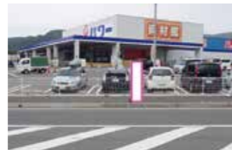
①Aコープ須恵店前 (旅石～山の神線 山の神方面回り)