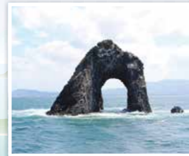
めがね岩がお出迎え！

この企画は、糟屋地区各市町の広報担当者が我が町をPRし、糟屋地区の地域振興に貢献することを目的として行なっています。