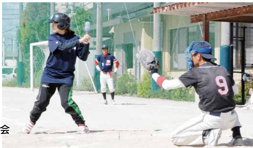
第38回町民ソフトボール大会