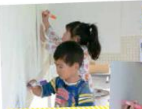
ご協力ありがとうございます!

「須恵町のよいところ」をたくさんの人に記入していただきました。須恵町の魅力を多く発信するため、皆さんだけがご存知の「須恵町の隠れた魅力」を探しています。そこで、9月13日(日)の軽トラ市で、ブースを開設し「須恵町のよいところ」を来場された皆さんに、自由に記入していただきました。およそ200人にご協力いただき、たくさんの魅力を集めることができました。ありがとうございます。記入いただいた「よいところ」を参考にして、須恵町のPRにつなげて参ります。