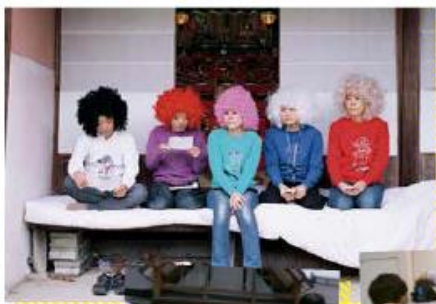
皆さんの家族写真で須恵町をPRしましょう!