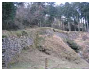
大野城跡の百間石垣

宇美町の南側にある四王寺山に、「国指定特別史跡大野城跡」があります。「日本書紀」の天智4年の記録に、「大野と椽、二城を築かしむ」という記述があることから、西暦665年に築造された日本最古の古代山城であることがわかります。「大野城跡」という名称から、お城が大野城市にあると思われる人が多くいますが、城内の約80%が宇美町にあります。