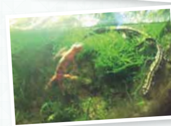
『マリンレポート 三題 ～サメ・クラゲ・イモリ～』