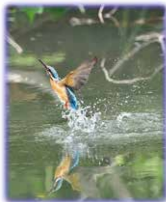
上杉 和稔さん 作