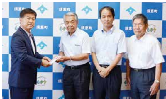
町長へ寄付を渡す宝満堂の皆さん

このたび、宗教法人 根本山 宝満堂から「町政に役立ててもらいたい」と寄付をいただきました。