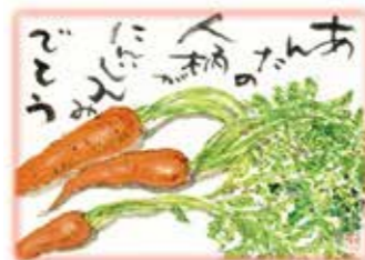
新井 光守さん 作