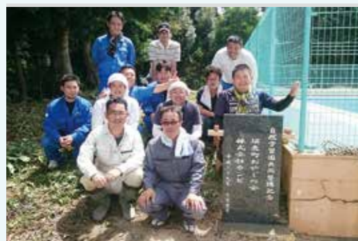
自然学習園の整備