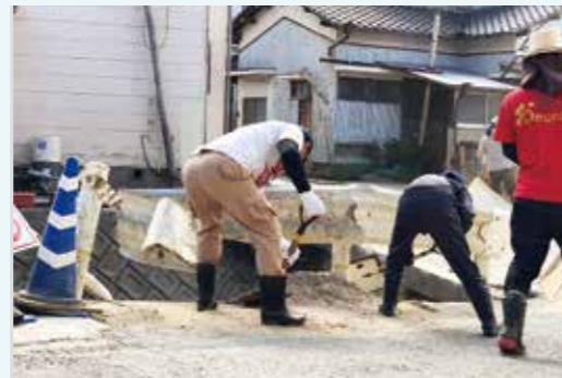
朝倉市杷木地区復興支援ボランティア