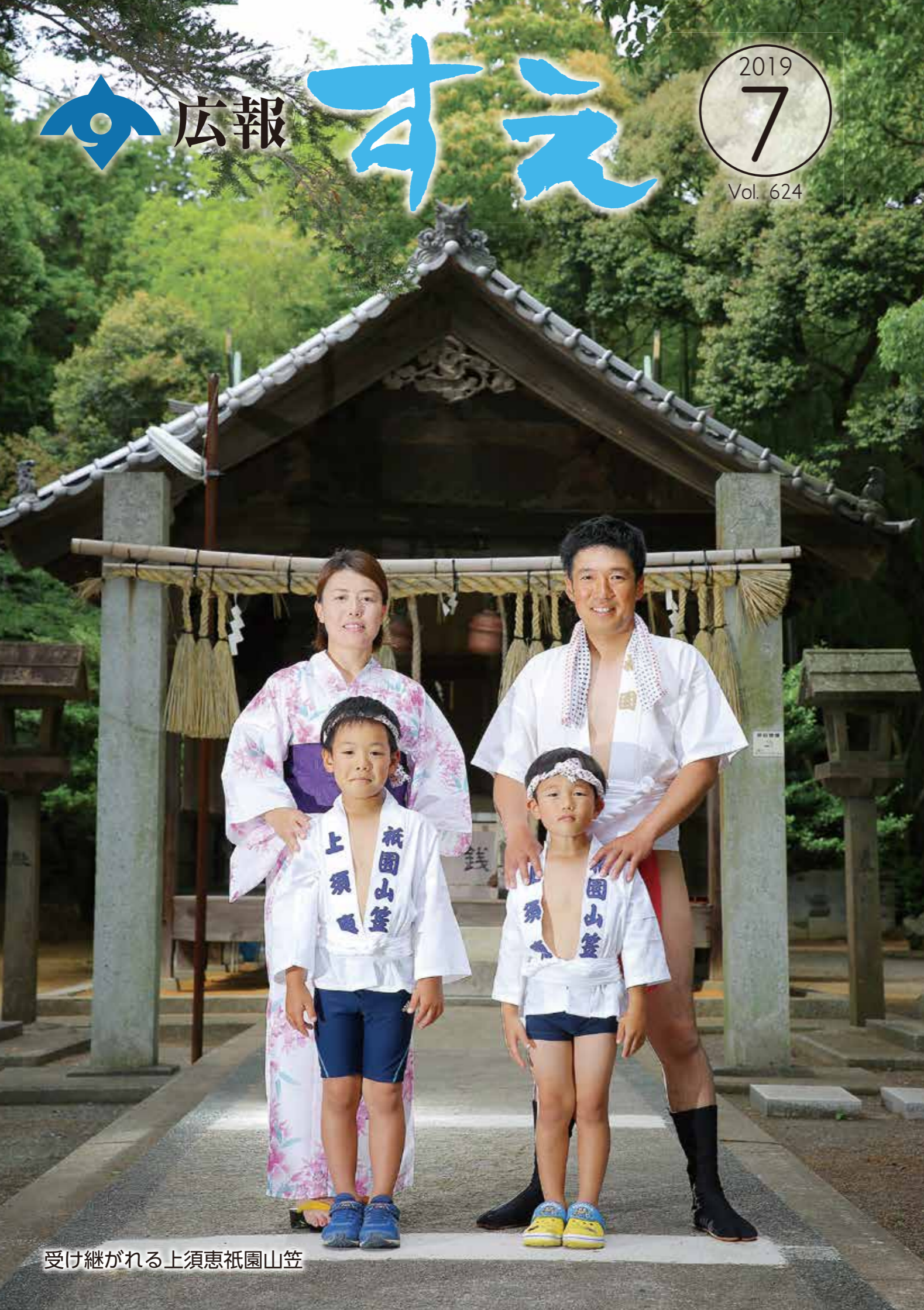
受け継がれる上須恵祇園山笠