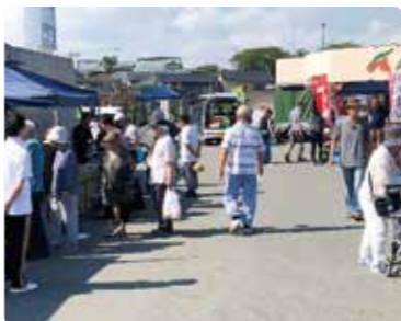
多くのお客様にご来場いただきました！