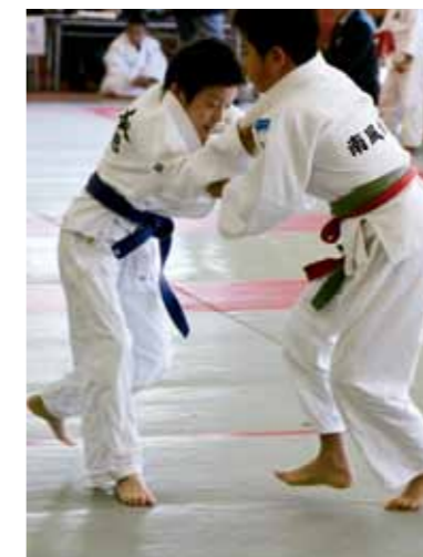
一歩も引かない組手