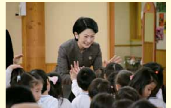
園児と触れ合われる紀子さま

幼稚園の御視察を約1時間行われ、園児や職員たちからの見送りを受け、幼稚園を御出発されました。