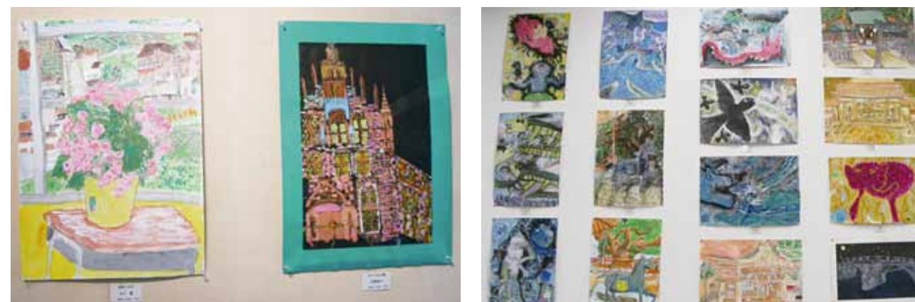
※昨年の展示風景です

平成26年度に実施された絵画コンクールで、佳作以上の賞を受賞した作品136点を展示します。須恵第一小学校42点、須恵第二小学校67点、須恵第三小学校27点です。