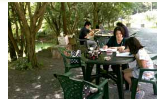
去年のイベント風景

※お子様は保護者同伴をお願いします。 ※画用紙は用意します。絵の具、色鉛筆、クレヨン、画板などをご持参ください。