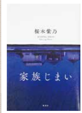
桜木 紫乃 / 著 集英社 / 出版

とある夫婦の元に、突然妹から一本の電話かかってきます。「ママがね、ぼけちゃったみたいなんだよ。」 認知症の母と、齢を重ねても横暴な父。両親の老いに姉妹は戸惑い、それぞれ夫との仲も揺れてしまいます。別れの手前にある、かすかな光、大人の諦観と慈愛に満ちた長編小説です。