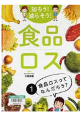
小林 富雄 / 監修 川下 隆・ひろ ゆうこ / イラスト 小峰書店 / 出版

「食品ロス」ってなんだろう? 食べられるのに捨てられるのが食品ロスです。日本の食品ロスはどれくらいあるのでしょうか? たくさんの食料を輸入する日本、なのに食品ロスが出るのはなぜ? あなたは食品ロスを出していませんか? 食品ロスを減らすための取り組みを紹介し、子どもたちにもできることを考えさせる全3巻からなるシリーズです。