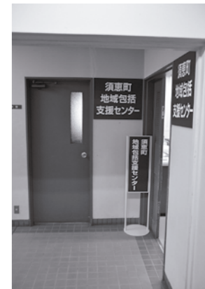
地域包括支援センター入口