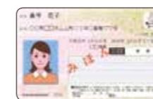
マイナンバーカード