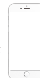
スマートフォン (マイナンバーカードに対応した)