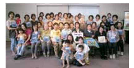
布絵本「おたんじょうび」完成