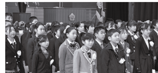
▲須恵第二小学校 卒業式

3月中旬、町内各小・中学校、幼稚園などで卒業式および卒園式が行われ、保護者や先生などに感謝の気持ちを伝えていました。在校生は、先輩から学んだことをしっかりと受け継いでいくことを誓い、卒業生を温かく送り出しました。