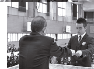
▶須恵中学校 卒業式