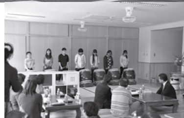
第一バスケットクラブ落成式では、5・6年生が太鼓披露