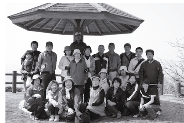
岳城山頂付近の千畳敷で記念撮影

3月15日（土）、すこやか歴史探訪（すこやかコミュニティ主催）が開催されました。この企画は、岳城登山をしながら歴史をたどるというもので、清滝（妙法寺）や高鳥居城跡などを巡り、参加者は学芸員による解説に耳を傾けていました。