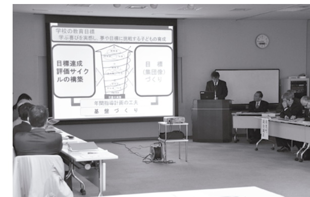
協議では活発な意見が交換されました

2月19日（水）、平成25年度須恵町教育委員会・校長会学校自己評価報告会（須恵町教育委員会主催）がアザレアホール須恵で行われました。各学校の校長が、自校の平成25年度における教育の取り組みを説明し、その成果と課題を報告しました。