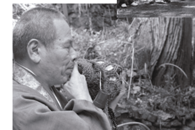
清滝（妙法寺）では法螺貝が吹かれ、参加者を送り出しました。