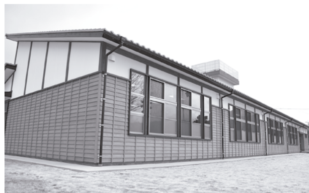
増築された立派な木造校舎

第二小校区内の児童数増加に伴い、教室数が不足したため、木造平屋建て校舎（4教室）を増築しました。