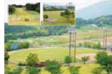
8 MAP D-5 運動公園若杉の森

福岡市を一望できる景観のよい公園です。野球場、天然芝の多目的グラウンド、芝生広場があり、手軽にスポーツや自然とふれあうことができるくつろぎと憩いの場です。