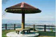
1 MAP A-3 岳城山展望台

須恵町と萩原町にまたがる標高381mの岳城山。展望台からは福岡平野と博多湾が一望できる絶景ポイントです。森林浴とともにパドウォッチングが楽しめます。山頂平相部には、中世山城の高層瓦葺の遺構が残り、室町時代には原所所在地となりました。