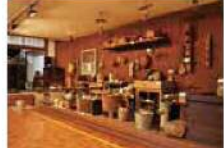
6 MAP C-4 歴史民俗資料館

全国的にも町立歴史民俗資料館が珍しかった昭和48年九州初の町立資料館として開館。先代の歴史を継ぎ、まちの財産として今の暮らしに生かそうという発想が実ったものです。古代から近代まで、須恵町の歴史を時々の流れに添って紹介しています。