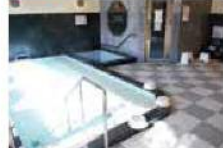
10 MAP D-3 ほたるの湯(福祉センター)

解放感たっぷりの露天風呂と趣の異なる2種類の浴場(男女日替わり)があります。健康湯も併設されており、健康増進・ふれあいの場として利用できます。(有料)