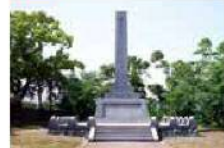
11 MAP E-3 新原公園

海軍の炭坑として明治23年に開坑した新原海軍炭坑は、昭和39年に閉山するまで地域の産業を支えました。第49坑の本部跡に位置する新原公園は、その資料が現存する唯一の場所です。