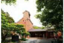
2 MAP C-3 久我記念館

洋画家・坂本繁二郎を顕彰した人物として有名な故・久我五千男氏の個人美術館。昭和60年に須恵町に誘われるほどの名声を得ていました。年間1,000人を超える来客のために周辺の民々は宿屋を営み「観覧人宿」として大いに賑わいました。