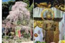
9 MAP D-6 左谷山建正寺

豊澤の作と伝えられる全長175cmの十一面観音像。最澄が開基したと伝えられる建正寺に安置されており、毎年4月の第1日曜日の御開帳で拝観できます。昭和29年に県指定有形文化財(彫刻)の第1号に指定されました。