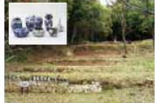
4 MAP C-4 須恵焼窯跡

1764年に築かれた「須恵焼」は、1784年に窯業とされて以来、豊田藩の唯一の磁器産地として発展し、明治35年頃まで続きました。血山にある「窯跡」は、県指定文化財で規模も福岡県最大を誇っています。