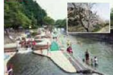
7 MAP D-4 仲農水辺公園

須恵川の流れを利用した幅20m、長さ120m、水深約40cmの河川プール(毎年7月下旬開放)や東屋などがあり、くつろぎのスペースです。周辺の河川道路は桜の名所となっています。