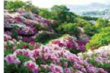
5 MAP C-4 血山公園

若杉山の山ろくに広がり、年には3万本のつつじが咲き乱れる名所。季節ごとに種の花、雪割、あじさい、紅葉を楽しめます。眼下には福岡市、博多湾を望む一大パノラマが広がります。カンラン岩の巨岩がゴロゴロと積み重なった「天然のロックガーデン」も見ものです。