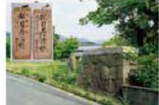
3 MAP C-3 眼療官場跡

江戸時代、日本四大眼科の一つに数えられた豊田藩医・田原眼科。遠くは北海道や鹿児島からも治癒に訪れるほどの名声を得ていました。年間1,000人を超える来客のために周辺の民々は宿屋を営み「観覧人宿」として大いに賑わいました。