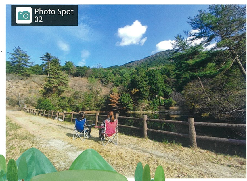
Photo Spot 02