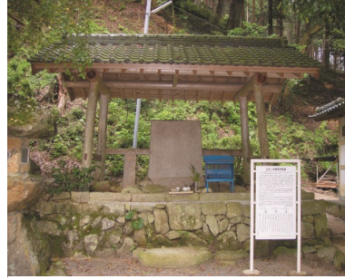
正中二年銘梵字板碑 正中二(1325)年 福岡県指定文化財

鎌倉時代の僧侶大乘坊妙蓮(みょううれん)が両親の供養と自分が犯した罪滅ぼしのために、法華経を一万回あげた記念碑です。正和(しょうわ)3(1314)年から正中(しょうちゅう)2(1325)年までの11年をかけて読まれました。法華経は普通にお経をあげて約9時間かかり、1万回読むには、連続で読んで約10年かかります。箱崎宮で読み始め、若杉山頂の太祖宮(たいそく)で数千部を読み、佐谷の観音堂で読み終えたことを示しています。この石碑は板碑(いたび)という形式で、関東地方に多く見られますが九州では非常に珍しいものです。花崗岩で作られており、平成13(2001)年に保存処理がなされました。