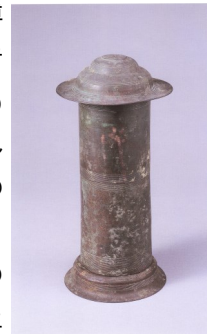
佐谷建正寺経筒 天治二(1125)年 東京国立博物館蔵 ※文献(5)より転載

今から約100年前の明治43(1910)年の3月、建正寺の裏山が土砂崩れを起こした時に、偶然3点の経筒(きょうづつ)が見つかり、現在は東京国立博物館の所蔵となっています。現在、観音堂入口の脇に石製の経筒の外函(そとばこ)があります。当時発見されたものかもしれませんが、3点のうち、天治(てんじ)二年銘の経筒には、「宋人 馮榮(そうじん ひょうえい)」という人名が線刻されています。宋人の銘文をもつ経筒は、北部九州から出土する経筒にみられます。ほとんどが墨書で書かれており、線刻のものは、佐谷の