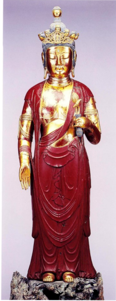
木造十一面観音立像(町指定文化財) 台座裏に元禄2(1689)年に仏師巖瀬(いわせ)又四郎による修理記録が残っています。像高122.2cm、クス材。平安時代 ※文献(4)より転載

佐谷建正寺がある観音谷の地名は、この像から由来すると考えられており、伝教大師に関する資料が数多く残っています。十一面観音像が安置される観音堂付近には、大日堂、県指定文化財正中二年銘梵字板碑(しょうちゅうにねんめいぼんじいたび)、経塚(きょうづか)群、少し離れたところに伝教大師堂と独鈷水(とっこすい)(影見の井(すがたみのい))があります。地名として百堂、仁王堂という地名が残っています。