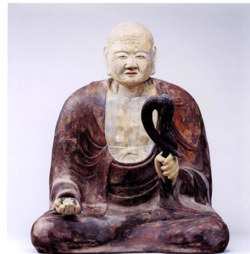
木造伝教大師坐像(町指定文化財) 『佐谷山建正寺縁起』によると、自らの姿を井戸に映して作ったものと伝わります。像高60.0cm、ヒノキ材。平安時代 ※文献(4)より転載