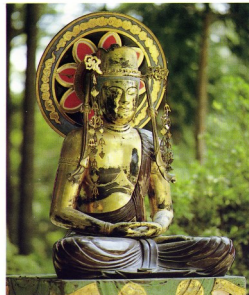
木造大日如来坐像(町指定文化財)