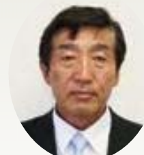
三上 政義 議員