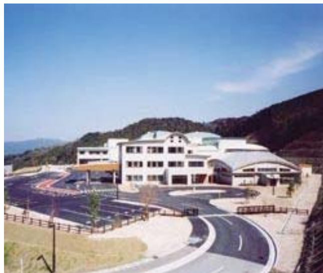
須恵町外二ヶ町清掃施設組合 “クリーンパークわかすぎ”