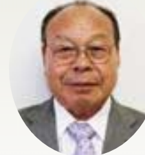
吉本 實 議員