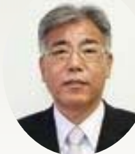
合屋 伸好 議員