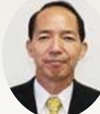
柴田 真人 議員