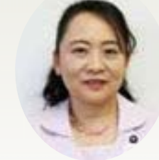
今村 桂子 議員