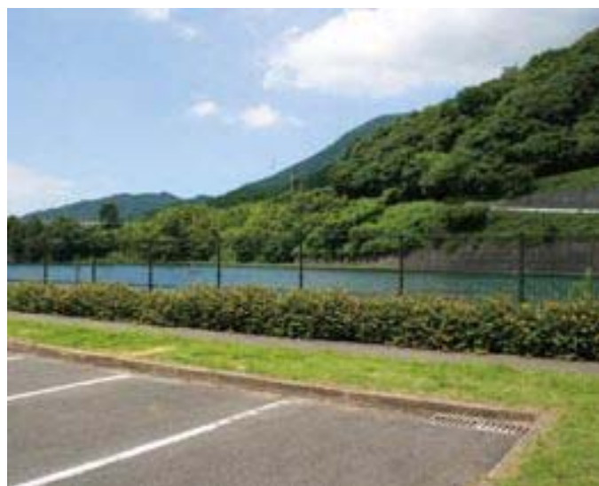
水道水源となっている “中柱田貯水池”